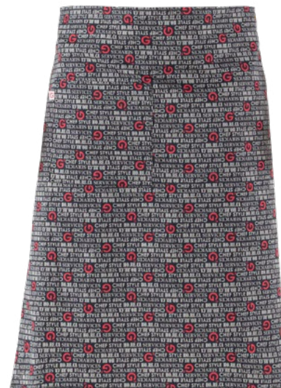
F020 G' horeca