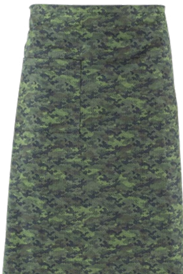
F019 Camouflage pixel